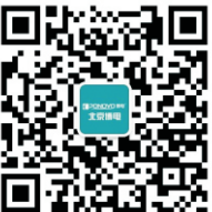
"扫一扫"关注北京博电微信公众号

欲了解产品详情，敬请致电博电总部或各地派出机构 24小时技术服务热线:400-680-0650 北京博电新力电气股份有限公司 电话: 010-58731010 传真: 010-58731816 地址: 北京市海淀区知春路甲48号盈都大厦C座 100098 国际部电话: 010-82755151-8020 内蒙古东 、 辽宁 : 024-31314420/31328422 浙江 、 福建 : 0571-88867519/0591-62700989 广东 、 海南 : 020-38105422 江苏 、 安徽 : 025-83344652/4653 西藏 、 四川 、 云南 : 028-85257761/6057 重庆 : 023-68625013 贵州 、 广西 : 0771-5618014 山东 : 0531-87923775 湖南 、 湖北 、 江西 : 027-59521918/1919 黑龙江 、 吉林 : 0451-87535873 河北 、 河南 、 山西 : 0371-67170077/0078 新疆 : 0991-6871822 内蒙古西 、 陕西 、 甘肃 、 宁夏 、 青海 : 029-89379801 北京 、 天津 、 河北 、 北 : 010-51926050 上海 : 021-62036771 南京技术服务部 : 025-83344652/4653 http://www.ponovo.cn