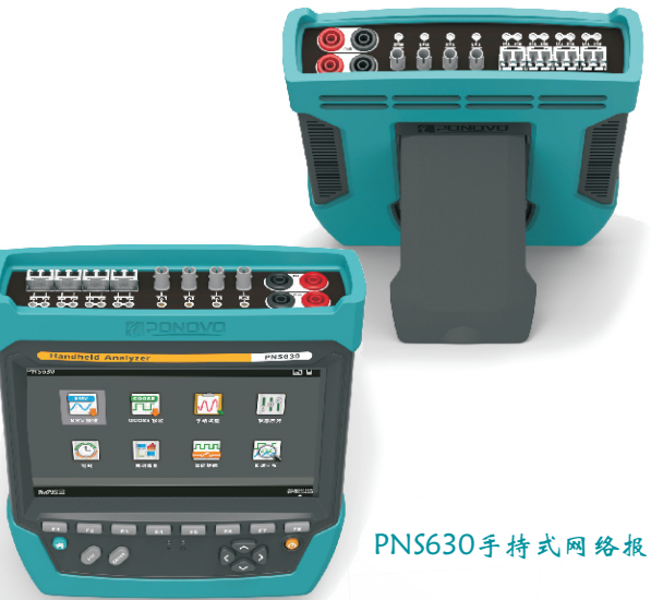
PNS630手持式网络报文分析仪